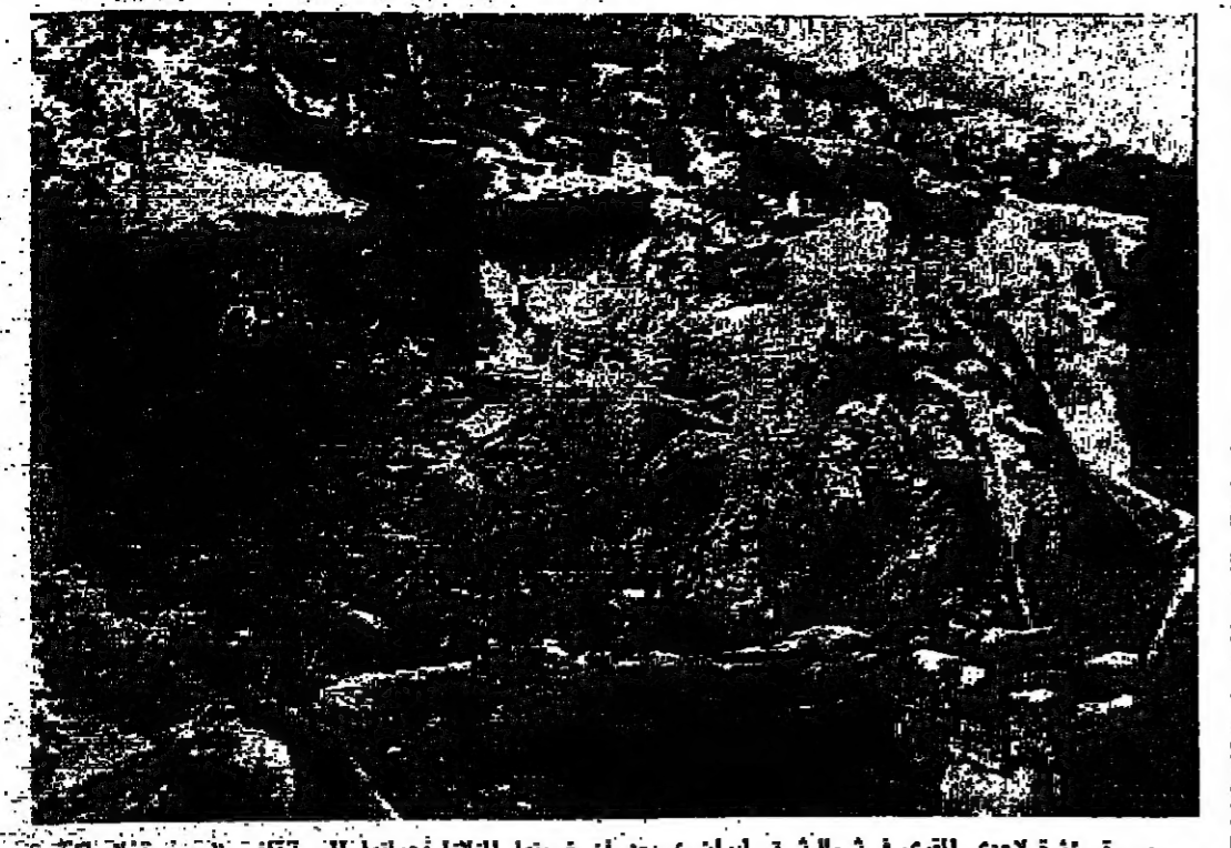
صورة مؤثرة لأحدى القرى في شمال شرق إيران... بعد أن ضربها الزلزال...